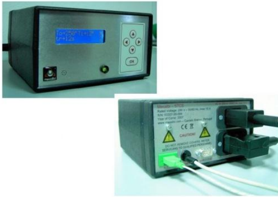
Module de Contrôle