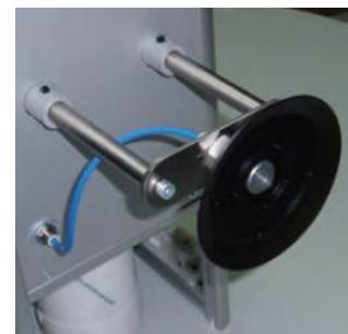
Fixation par ventouse réglable