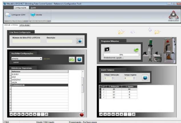
Logiciel de programmation